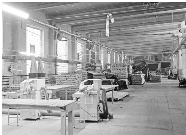
В цехе «Лесного Союза».